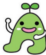
秋田市ごみ減量キャラクター エコアちゃん