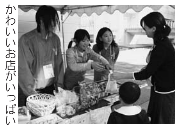
かわいいお店がいつぱい

子どもたちが市民になって働き、学び、遊ぶことで社会の仕組みを学びます。子どもたちのかわいいお店にぜひ遊びに来てね!