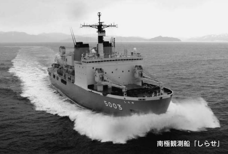
南極観測船「しらせ」