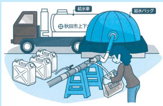
秋田市防災コーナー http://www.city.akita.akita.jp/city/gn/ds/

クなどにより応急給水を行います。避難施設は小・中学校、高校などです。自宅から一番近い避難施設を確認しておきましょう。避難施設は市ホームページ(秋田市防災コーナー)や市民利便帳などで確認できます。清潔なポリタンクなどを用意しておく。水の持ち運びに便利です。