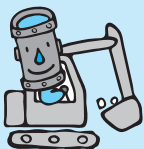
地震に強い水道管を布設しています

のポンプが停止することがあります。このような場合、ポンプの手前にあるじゃ口(応急給水栓)から給水することができ、建物の管理人などに確認しておきましょう。