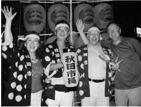
米国アラスカ州キナイ半島郡交流訪問団のみなさんと(8月3日)