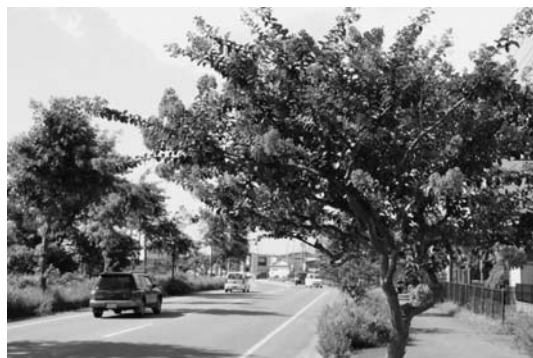
この夏のサルスベリは“元気いっぱい”(御野場)

また先ごろは、秋田市と友好都市提携している蘭州市がある中国・甘肅省でも集中豪雨による土石流で多くの命が奪われました。さらには、秋田市においてもお盆のさなか、豪雨と河川の氾濫で住宅や農地が被害に遭っています。これら一連の現象をみていると、とにかく局地的に起こる、という