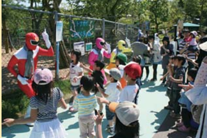
春の動物ふれあいフェスティバル(6月)