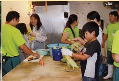
サマースクール(7月)