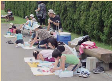
親子のふれあい写生大会(7月)