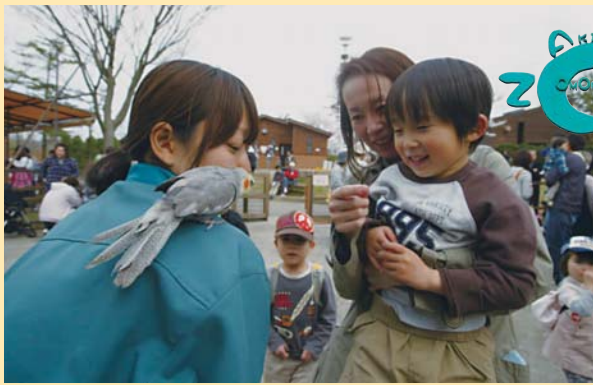
動物とふれ合おう！