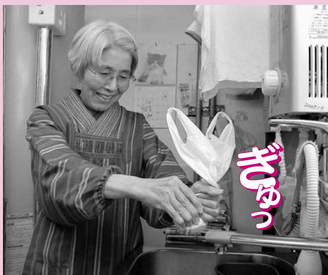
「普通の袋でも自分で穴を開ければ水切り袋になりますよ」