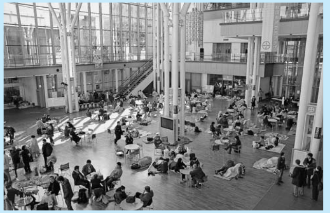
東北地方太平洋沖地震では600人あまりがアルヴェに避難しました(3月12日)