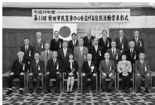
住民活動賞表彰式で(4月20日)