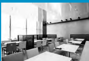
レストラン クオーレ