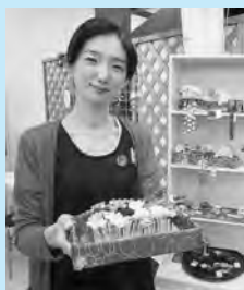
つまみ細工の工房 すず花 ~suzu-hana~

和装だけでなく、普段着のアクセントアイテムとしてもおしゃれ♪ぜひ、お越しください。