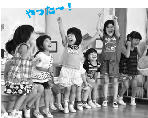
雄和中央保育所で

保育士人材バンク登録ホームページ http://www.city.akta.akita.jp/city/ch/wf/bank/bank.htm