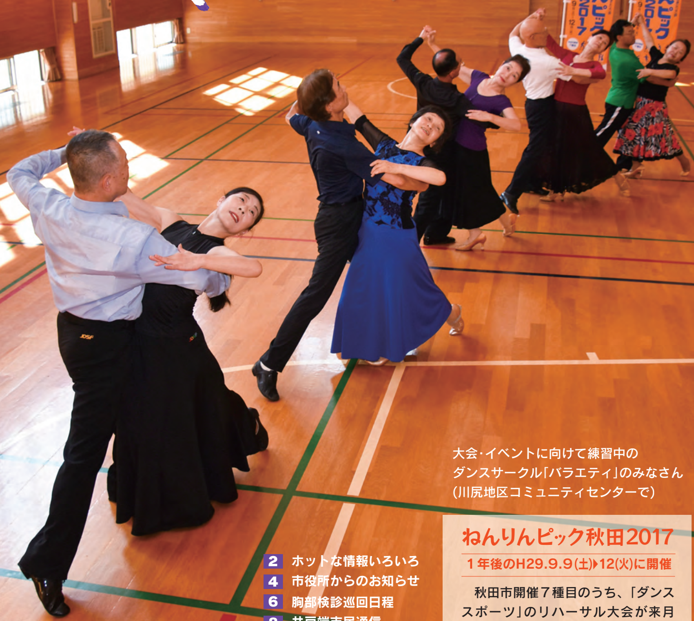
大会・イベントに向けて練習中の ダンスサークル「バラエティ」のみなさん (川尻地区コミュニティセンターで)