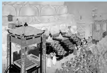
「大仏開眼」1904年 東大寺蔵 (前期展示)

秋田出身の日本画家・寺崎広業(1866-1919年)は、伝統的な画法と写実を融合させた格調高い画境を拓き、歴史画・美人画・風景画などに優れた作品を残しました。