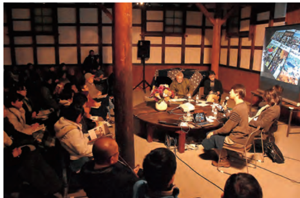
「高清水」の仙人蔵で行ったシンポジウム。 醸し出される蔵の雰囲気がいい感じでした

討を重ねていくこととしており、企画段階から多くの市民に関わっていたみたいと考えています。検討の過程で、これまで交わることのなかった人たちが出会ったり、普段見逃していたまちの魅力を見つけたりすることに、大きな意味があると思っていますので、関心のあるかたはぜひご参加ください。