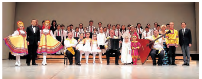
昨年11月に開催した、「ロシア歌と踊りのアンサンブル」で

さらに、常陸太田市と秋田県仙北市の3市で結んだ、連携交流都市提携10周年にもあたり、各都市と記念事業を随時開催する予定です。企画調整課国際交流担当☎(888)5464