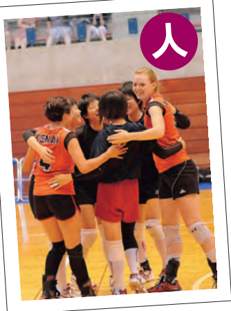
キナイ半島郡との高校生バレーボール交流(平成26年)

8月には、友好・姉妹都市などから青少年を秋田市に招き、市内高校生と地球環境問題など、各都市が直面する共通の課題をテーマに話し合う「青少年会議」を開催する予定です。詳しくは、広報あきたで改めてお知らせします。