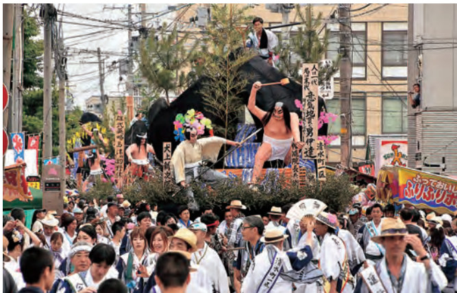
祝・ユネスコ無形文化遺産登録！ 例祭は毎年7月20日・21日に開催しています