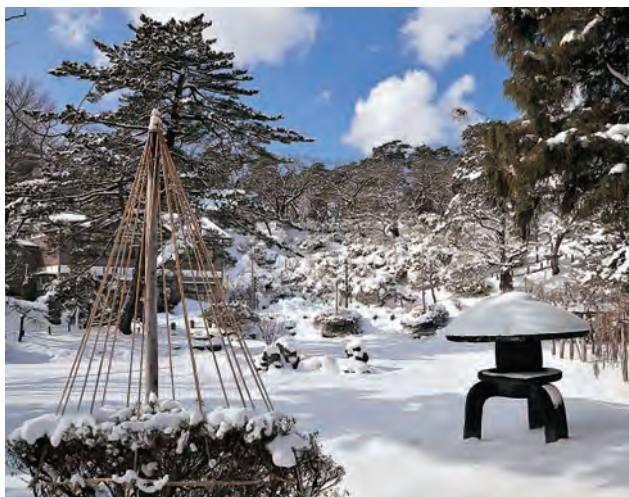
青空広がる千秋公園。雪吊りは冬の風物詩ですね

私たちの住むまちを舞台に、私たちの手で作り上げていく新しい取り組みです。今後、「夜学」と名付けた勉強会を実施し、テーマや開催までのロードマップ(行程表)、体制づくりなどの検