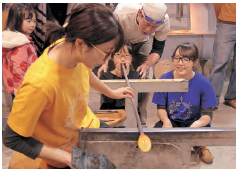
「秋田のガラス・プロジェクト」でガラス細工に挑戦！ 新たな工房の完成も楽しみ♪

新屋地区では7月、「(仮称)秋田市新屋ガラス工房」がオープンします。地域のみなさんとワークショップなどを重ねながら進めてきたもので、ガラス