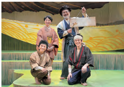
にぎわい交流館では、ミュージカル「新リキノスケ走る！」を絶賛上演中！