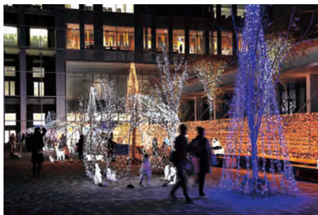
今冬もイルミネーションが、秋田駅～エリアなかいちの街並みを彩っています