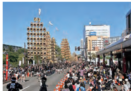
昨年6月に「食と芸能大祭典」を開催。広小路での竿燈演技は迫力満点でした