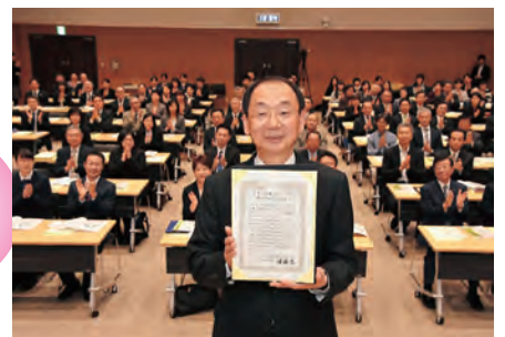
「イクボス」を宣言。率先して仕事と生活 が両立できる環境づくりに努めます