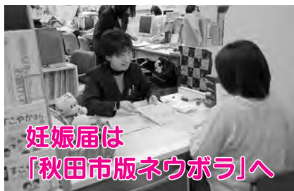
妊娠届は「秋田市版ネウボラ」へ

「秋田市版ネウボラ」(市保健所2階)では、母子保健コーディネーター(助産師)が中心となり、妊娠・出産・子育ての相談に応じています。