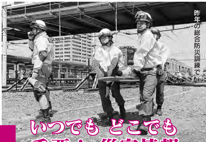
昨年の総合防災訓練で

未登録の場合や避難先を異動した場合は、秋田市防災安全対策課への情報提供をお願いします。