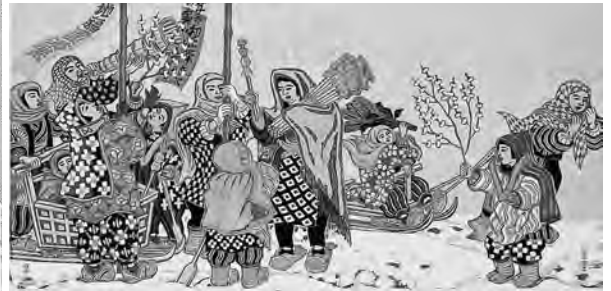
「雪国の子もたち」昭和18年(1943)