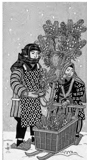
「花四題」より「冬(なんてん)」昭和14年(1939)