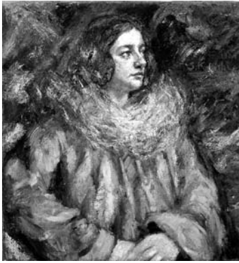
小西正太郎 赤衣着物の女 1924年