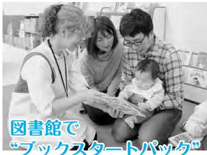
図書館で “ブックスタートパック”

絵本の読み聞かせを通して、親子の絆づくりを支援するため、各市立図書館など(明德館を除く)で絵本の配布を行っています。開催日と会場は、下記のホームページをご覧ください。母子健康手帳を持って、直接会場へどうぞ。