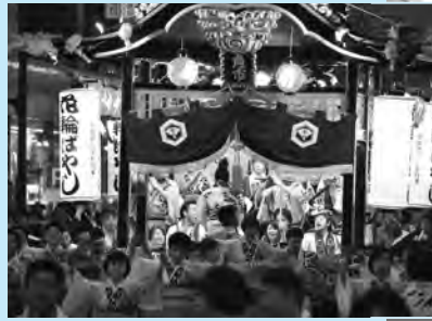
花輪祭の屋台行事