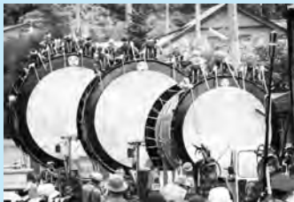
綴子(つづれこ)大太鼓

問▶ 実行委員会事務局(秋田観光コンベンション協会内) ☎(824)1211 http://koreaki.jp/ これが秋田だ! 検索