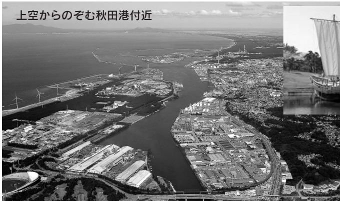
上空からのぞむ秋田港付近