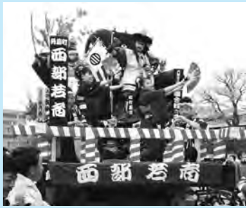
角館祭りのやま行事