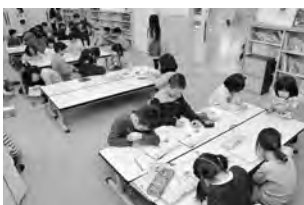
さっそく宿題、エライ！