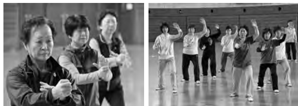
練習に集中する秋田県代表チームの2チーム。右が「AKITAこまち」、左が「サフラン」のみなさん

高得点を狙うには、個々の技術を磨くのはもちろん、集団での動きを合わせ、いかにシンクロさせるかが鍵となります。各チームによって演技の構成もさまざま。流れるように滑らかな動作を見比べるのも観戦のポイントですね。