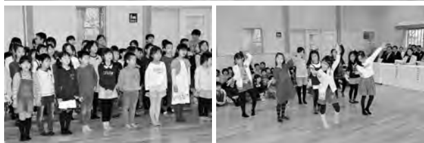
合唱に「恋ダンス」、みんなで完成をお祝いしました