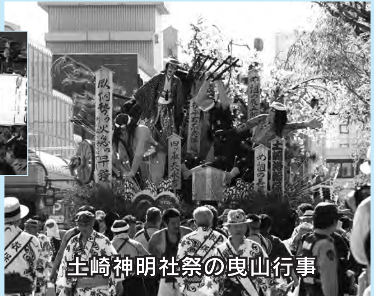
土崎神明社祭の曳山行事

県内の食と伝統芸能が中心市街地に大集合！ 昨年、ユネスコ無形文化遺産に登録された秋田 県の3行事も共演します。世界に誇る秋田の祭 りをお見逃しなく！