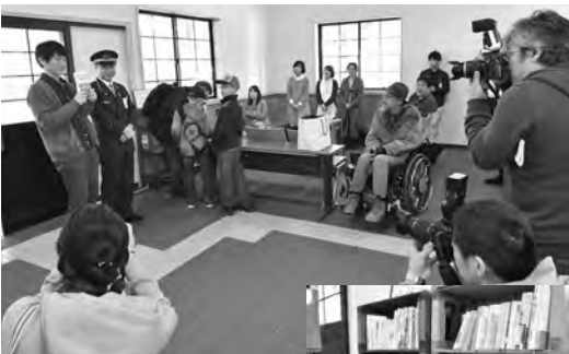
持ってきた本の思い出を一言。一冊にまつわるエピソードも、みなさん十人十色でした