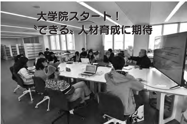
大学院の授業風景。芸術によるまちづくりや地域貢献など、自分の感じたことについて、自由に意見を述べ合いました