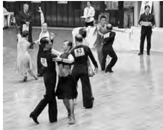
昨年のリハーサル大会の様子

きれのあるステップをより華やかに演出し、観客を魅了します。今大会では、世界大会にも出場するレベルの選手も参加予定です。見所たくさん“ダンスの祭典”を、ぜひ会場でご覧ください!