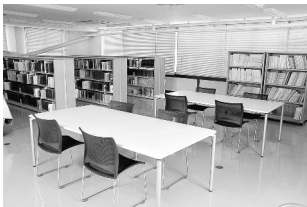
資料閲覧コーナー

資料閲覧コーナー(市役所分館1階)では、市政に関する資料などを自由にご覧いただけます。 開示を請求できるかた 情報公開 ①市内に住所があるかた ②市内に事務所がある個人や