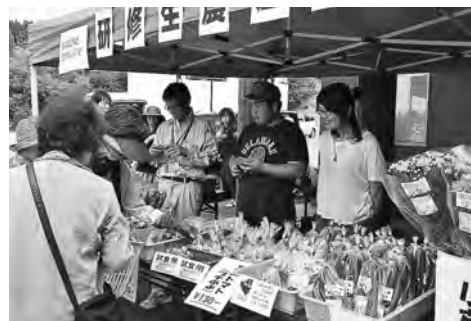
ホウレン草、アスパラガスが人気！今回販売したのは研修2年目のみなさん(7月29日)