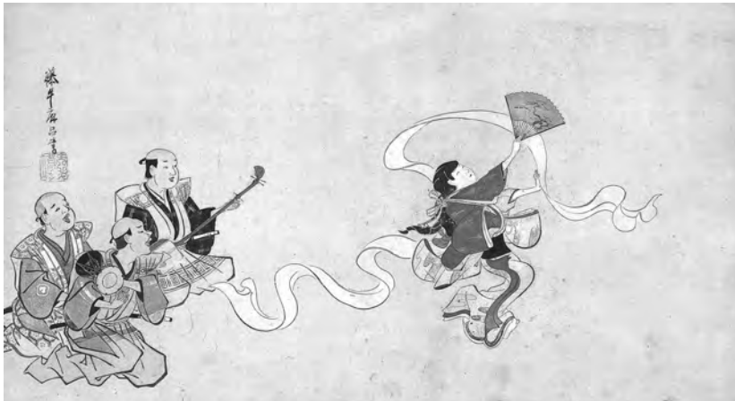
重要文化財 英一蝶「布晒舞図」江戸時代：17-18世紀

埼玉県にある遠山記念館が誇る一万点余りにおよぶコレクションの中から、本展では、王朝文化の精華を伝える「佐竹本三十六歌仙絵 頼基」や、江戸元禄期を代表する画人・英一蝶による「布晒舞図」といった重要文化財6件をはじめとした、日本美術の名品65件を紹介いたします。ぜひご鑑賞ください。