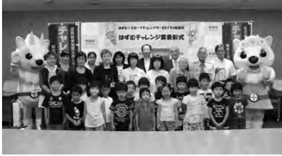
7月28日の表彰式で。受賞団体のみなさん

問い合わせ 人事課☎(888)5429・FAX(888)5430 Eメール ro-gnps@city.akita.akita.jp