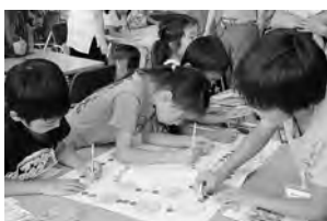
みんなですごろく作り！完成品は園内に展示しています