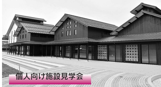
個人向け施設見学会