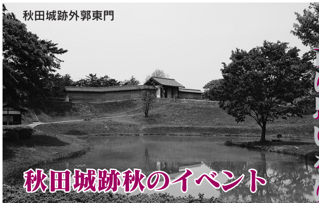
秋田城跡外郭東門