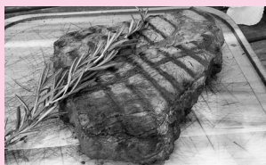
バーベキューで盛り上がる