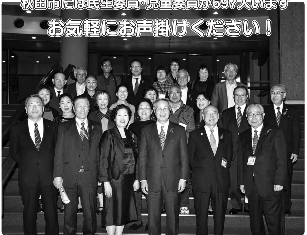
10月13日の秋田市社会福祉大会に参加された民生委員・児童委員のみなさん