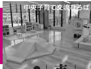
中央子育て交流ひろば

市の事業について、詳しくは各課へお問い合わせいただくか、下記ページをご覧ください。