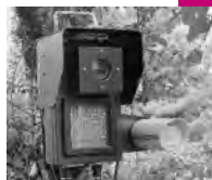
監視カメラ「みてるくん」

春先は、引っ越しなどにより、ごみの不法投棄が多くなります。不法投棄により検挙された場合、5年以下の懲役もしくは1千万円以下の罰金、またはこれらの併科(同時に二つ)に処せられます。ごみは、出し方をよく確認し、正しく出しましょう。