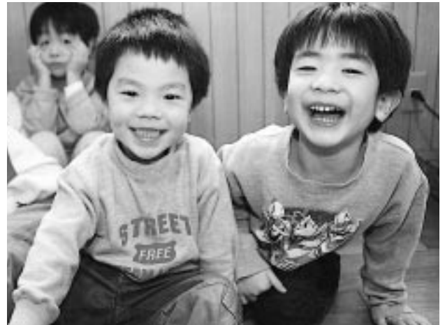
子どもたちの元気な声が何よりです (白百合保育園)