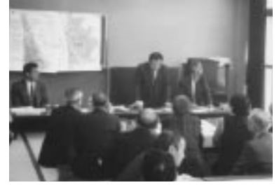
西部地域まちづくり懇談会