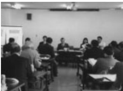
南部地域まちづくり懇談会