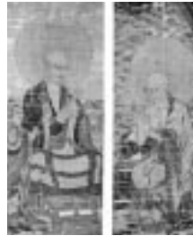
県指定文化財 十六羅漢像