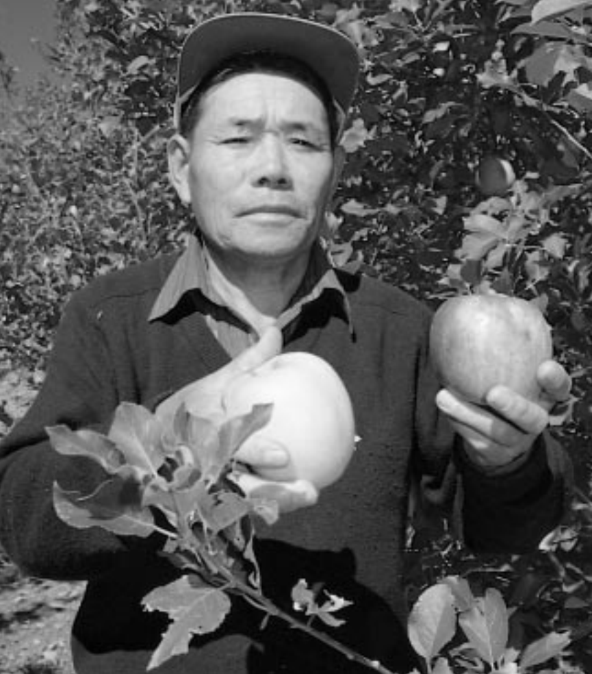
もぎたてのおいしいりんご。みなさんもいかがですか