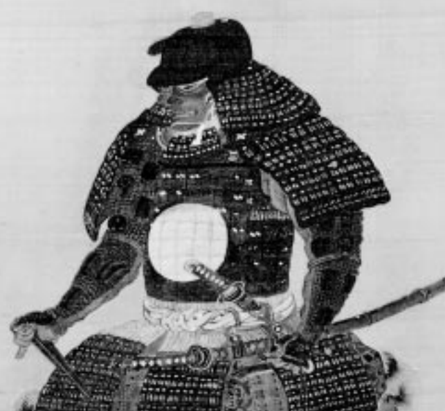
久保田城を築城した初代藩主・佐竹義宣