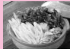
大森山動物園ときりたんぼ