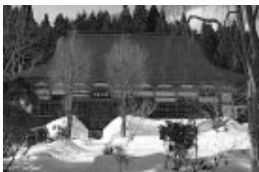
雪解けが待ち遠しい補陀寺本堂