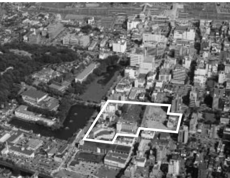
日赤・婦人会館跡地周辺の中心市街地