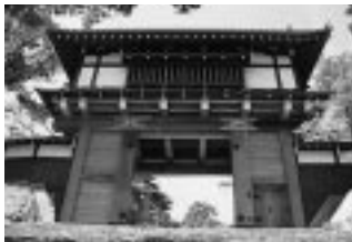
千秋公園に整備された表門