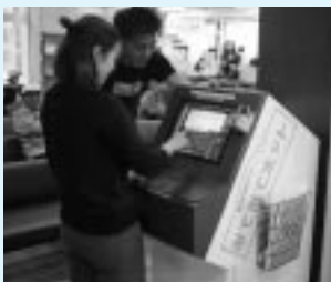
市庁舎1階の公衆端末

どなたでも無料でインターネットができる公衆端末「みてみてポット」を設置しています。また、市民相談室となりの資料閲覧コーナーにパソコン3台を置いています。お気軽にご利用ください。