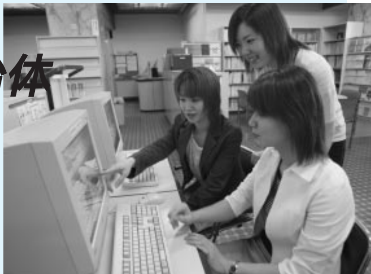
市役所1階の資料閲覧コーナーに、だれでも自由に使えるパソコンを設置しました。お気軽にご利用ください

市役所市民ホール 土崎・新屋支所 市水道局 中央図書館明德館 女性学習センター 秋田公立美術工芸短期大学 中央・土崎・東部・西部・南部・北部の各公民館 秋田銀行(本店、駅前支店、大町支店、新屋支店) 秋田パークホテル 卸センター会館 秋田空港ターミナルビル