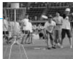
6月8日、ちびっこスポーツのついで