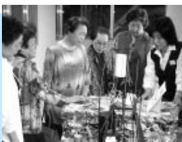
リサイクルプラザ見学の様子