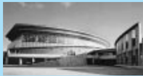
県立屋内温水プール