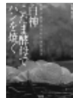
白神こだま酵母でパンを焼く

やむちん(焼物)、紅型など、沖縄には豊かな自然とアジアとの交易で育まれ、伝えられてきた様々な工芸品があります。沖縄の手仕事の美を紹介します。