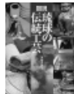
図説 琉球の伝統工芸

中央図書館明徳館☎(832)9220 土崎図書館☎(845)0572 新屋図書館☎(828)4215 市立図書館の蔵書が、インターネットで検索・予約できます。新着図書の一覧もあります。貸出希望図書館の指定も可。検索・予約は無料。お気軽にご利用ください。 http://www.city.akita.akita.jp/