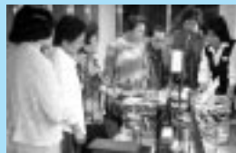
リサイクルプラザ見学の様子