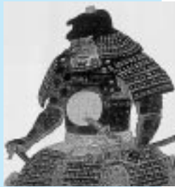
初代藩主・佐竹義宣

多くの人々が集い、祝い、新しい文化の創造と次の時代を切りひらく原動力となるような事業をイメージしています。創造性豊かな企画アイデア、ロゴマーク、キャッチコピーをお寄せください。