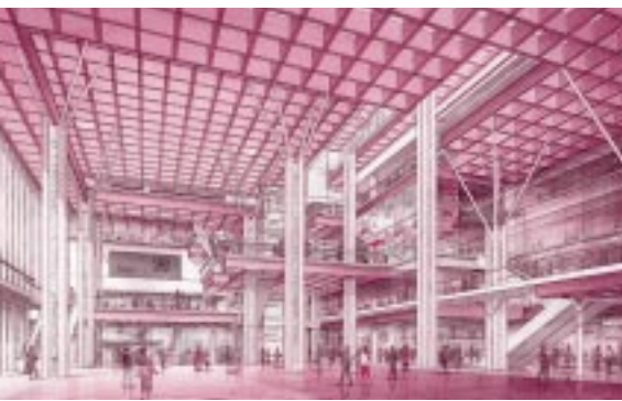
アトリウムは市民が集う憩いの場に