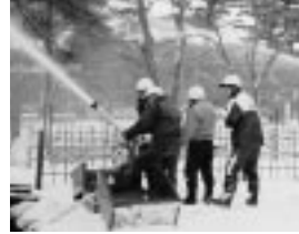
天徳寺での防火訓練

秋田市には貴重な文化財がたくさんあります。市民の財産である文化財を火災・地震などの災害からみんなで守り、後世に受け継いでいきましょう。