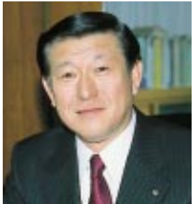
秋田市長 佐竹 敬久