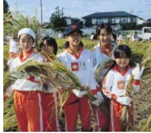
自分たちでお米を育てる学校農園