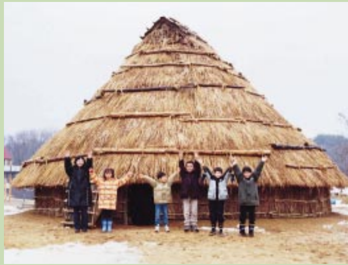
2200年前の弥生時代の竪穴住居を復元。直径8mのほぼ円形で、高さ約6mもあるかやぶき屋根。床面積は約50㎡で、これは30畳分！の広さになります。当時、1軒に1家族6～8人が住んでいたと考えられています

御所野にある国指定史跡「地蔵田遺跡」(愛称・御所野「弥生つこ村」)は、日本で初めて発見された木柵で囲まれた弥生時代の集落跡です。いまこの集落跡を、市民のみなさんの手作りで復元中ですが、このほど、今回の表紙でも紹介している竪穴住居一軒が完成しました。このあとも、同様の竪穴住居二軒や集落を囲んでいた木柵などを整備していく予定です。