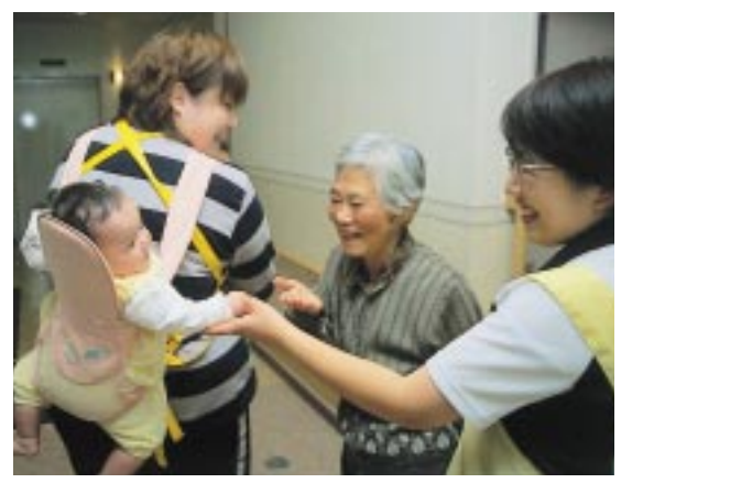
地域で支え合うところを育みます ...昨年11月にオープンしたウエルビューいずみ