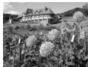
雄和国際グリア園