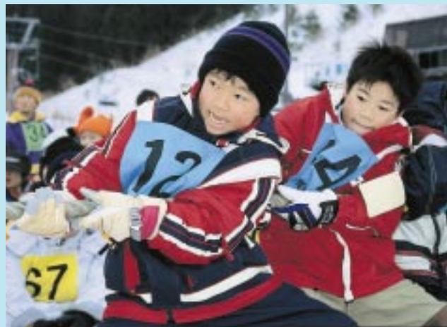
オーパスちびっこ雪まつり