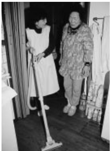
家事援助は、買い物と家の掃除