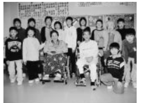
おじいちゃん、おばあちゃん、乗り心地はどう? ものすごくしっくりくるな