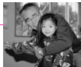
東部公民館の世代間交流会で。こま回し、エイッ!

広報クイズの当選者は、毎回、市政記者室の記者のかたに厳正に抽選してもらっています(広報課)