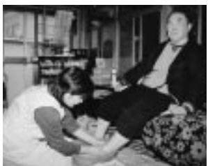
身体介護。冬は足浴、夏は近所の散歩などをします