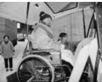
車いすごと乗れる送迎バスで出発