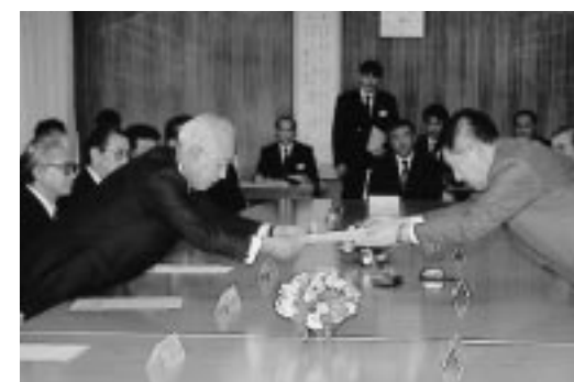
河辺町の大山博美町長