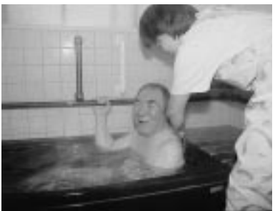
「入浴が楽しみ」と昭夫さん。入浴時間は約20分です