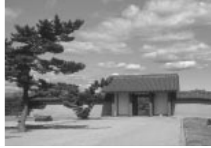
史跡秋田城跡・東門

町内会や婦人会など各種団体を対象に、市の施設をご案内します。前期(5・6・7月)と後期(9・10月)の年2回募集します。今回は前期分です。