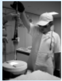
ボトルクラフト体験

申し込み 秋田市リサイクルプラザtel(829)1188 (平日の午前9時30分～午後4時)