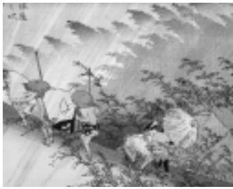
歌川広重「東海道五拾三次之内・庄野」