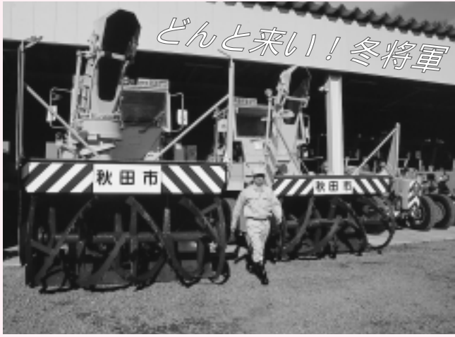
出動を待つ大型除雪車