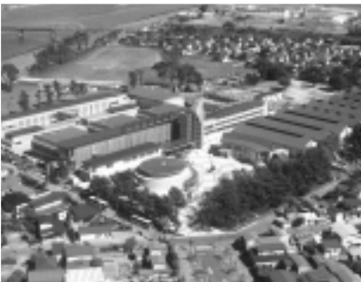
美術工芸短大と附属高等学校