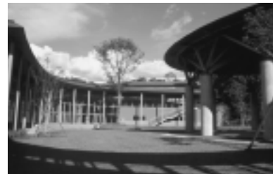
太平山自然学習センターまんならめ

町内会や婦人会など各種団体が対象です。前期(5・6・7月)と後期(9・10月)の年2回募集します。今回は前期分です。