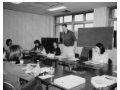
河辺町多目的総合センターで行われた英会話教室