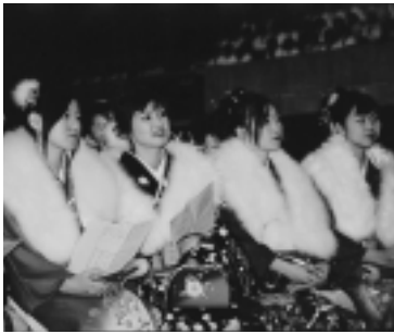
秋田市新成人のつどい

緊急雇用創出特別基金事業を活用した講習会は平成十六年度で終了しますが、既存のパソコンを活用した講習会は、継続実施します。