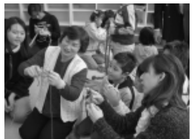
雄和町農村環境改善センターで行われた指編み教室