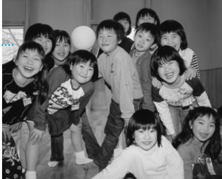
金足西児童館（平成16年4月1日開館）

秋田市 児童館17施設 児童センター14施設 開館時間：午前8時～午後9時 児童の利用時間：平日▶午後1時～6時 土曜日、夏休みなど▶午前8時30分～午後6時 河辺町 児童館1施設 開館時間：午前9時～午後5時 雄和町 施設なし