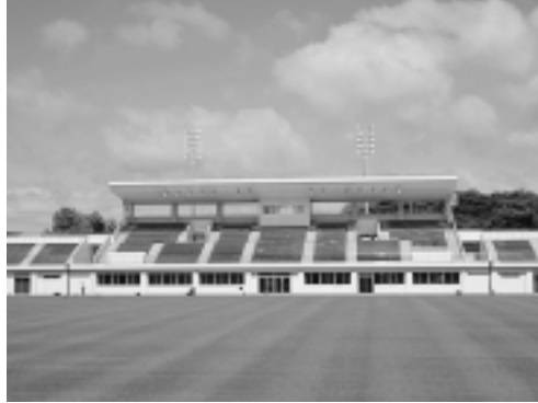
八橋球技場メインスタンド

八橋球技場のメインスタンドが完成しました。サッカーやラグビーなどに使用できる芝生グラウンドのほか、施設内にある会議研修室、役員記録室のみの利用も可能です。申込受付は7月5日(月)から。