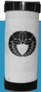
箱提灯 赤れんが郷土館蔵

不審なメールやワン切りには安易に反応しないようにするとともに、着信設定機能を使うなど、自分を守るための対応が必要です。