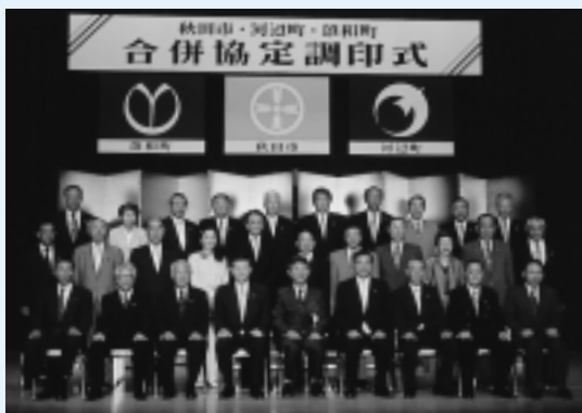
審議を行った合併協議会委員のみなさんと寺田知事