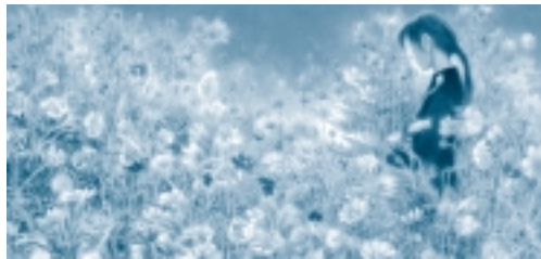
作品「秋桜」部分c 伊勢英子