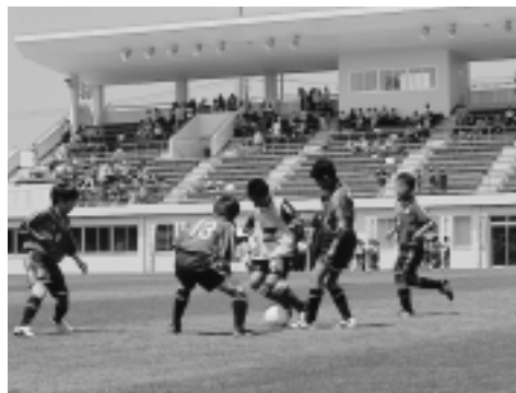
メインスタンドを背に

秋田市は、右の9競技13種目の会場となります。開催まであと3年、国体を盛り上げる気持ちの準備も“位置につけ!”ですネ!