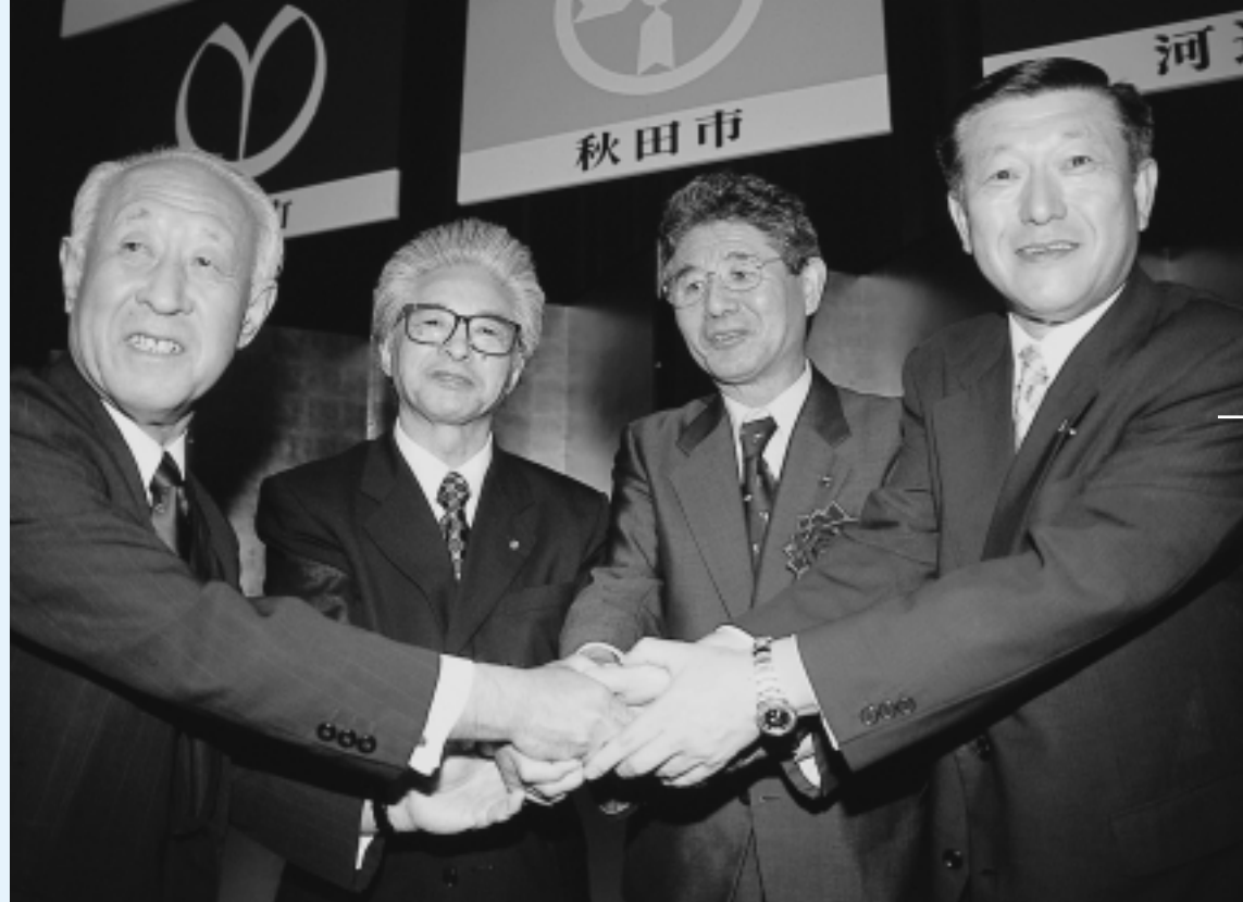
左から大山河辺町長、伊藤雄和町長、寺田秋田県知事、佐竹秋田市長