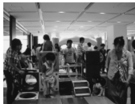
アルヴェ子ども未来センター