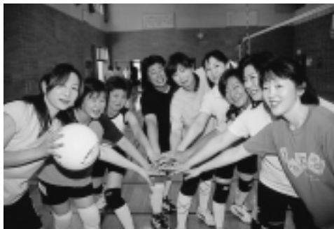
体育館ではバレーサークルが活動中！