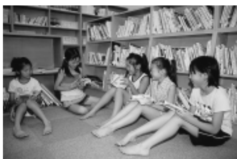
「地域の図書館」大町文庫を引き継いだのも特徴。夏休みは、子どもたちでにぎわっています