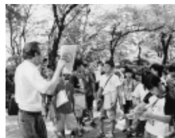
昔の姿を思い描きながら千秋公園を散策

秋田藩にまつわる講義や千秋公園の散策などで建都400年を学ぶ特別授業が、市内の小学校6校で開かれました。