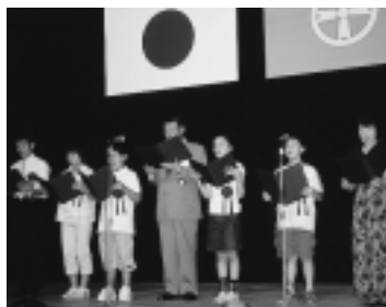
ふるさと秋田への想いをこめて