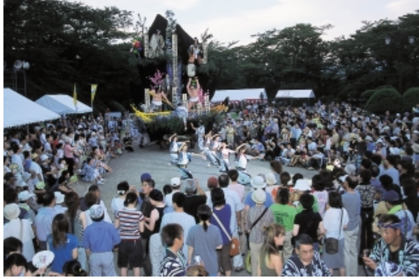
夜の千秋公園が7万人の人出でにぎわいました...土崎の港曳山まつり