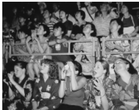
海外のお客様たちも`暑い、秋田に大満足！

翌八月一日にはアルヴェでの本番 の式典、二日にはドイツ・パッサウ 市との姉妹都市提携二十周年記念式