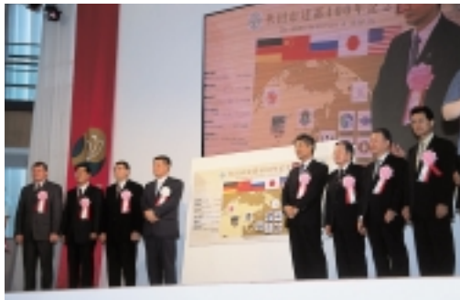
国内外の友好都市からも大勢のかたがたが集まってくれました