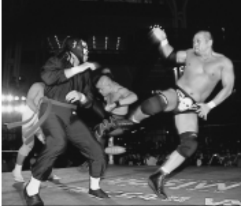
みちのくプロレス「アルヴェマッチ」

7月16日から19日まで行われた秋田拠点センター「アルヴェ」のオープニングイベントには、約5万人が来館！大盛況のスタートを飾ったアルヴェ。市民活動、市民交流の拠点として期待がふくらみます！