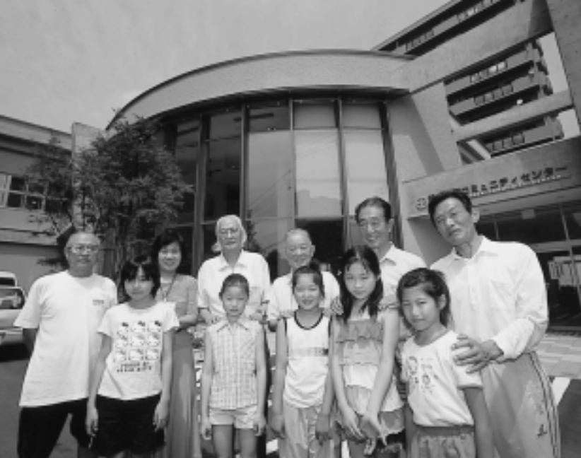
管理運営委員会のみなさんと、コミセンに来た子どもたち