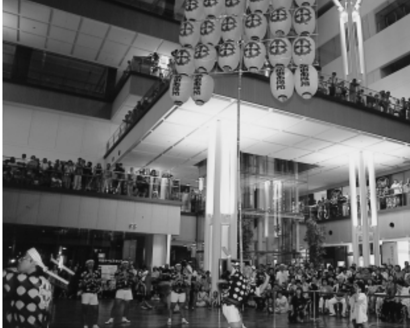
光と音のファンタジア

7月16日から19日まで行われた秋田拠点センター「アルヴェ」のオープニングイベントには、約5万人が来館！大盛況のスタートを飾ったアルヴェ。市民活動、市民交流の拠点として期待がふくらみます！