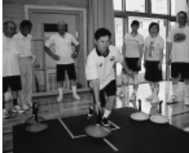
ユニカールに挑戦！