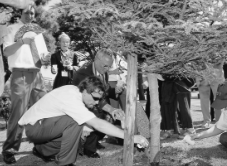
友情も大きく育つことでしょう