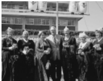
華やかに正装したかたも参列

8月2日、姉妹都市のドイツ・パッサウ市訪問団のみなさん約60人が、市役所前庭に“友情の木(ドイツウヒ)”を植樹しました。姉妹都市提携20周年を記念し、両市の友情が、これからも年輪を重ねて、さらに大きく育っていくことを願うものです。この日は20周年記念式典も開催し、姉妹都市として引き続き交流を深めていくことを確認しました。